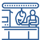
Цех убоя скота