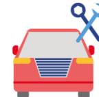
Станции технического обслуживания легковых автомобилей