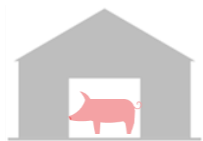
Помещения для свиней

ЗА СЧЕТ НОВОГО СТРОИТЕЛЬСТВА И РЕКОНСТРУКЦИИ ДЕЙСТВУЮЩИХ ОБЪЕКТОВ